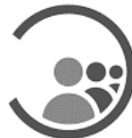
ФБУН Центральный НИИ Эпидемиологии Роспотребнадзора